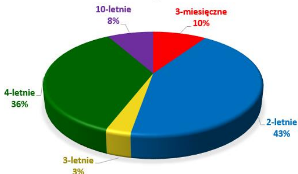
SPRZEDAŻ OBLIGACJI OSZCZĘDNOŚCIOWYCH W 2017 R.